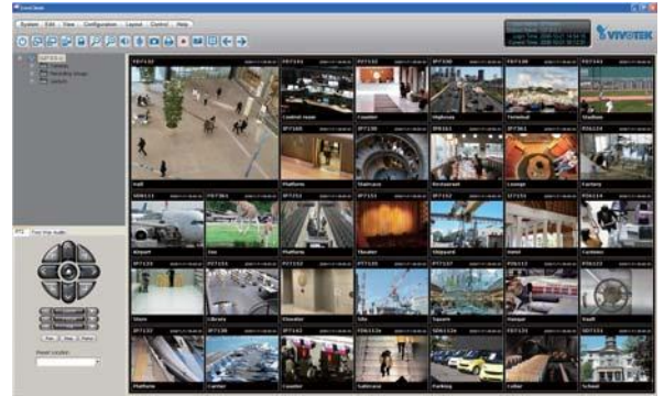
32- canal de Monitoramento de Vídeo ao vivo

ST7501 Playback . Acesso ao servidor ST7501 . Browses the database of recorded video from the server in day base . Máximo de 16 canais de reprodução simultânea . 1x1, 2x2, 1 + 5, 3x3, 1 + 12, 4x4 reprodução layouts . Suporta poderosas funções de reprodução. . 1/8, 1/4, 1/2 de reprodução abrandamento. . 2, 4, 8, 16, 32, 64 de aumento de velocidade de reprodução. . Suporta exportadores de arquivo AVI de vídeo gravado em instantâneos em tempo real as imagens de vídeo gravadas . Imprime as imagens de vídeo gravadas . Suporta múltipla comutação do monitor . Potente motor de busca . pesquisa de eventos . Entrar pesquisa